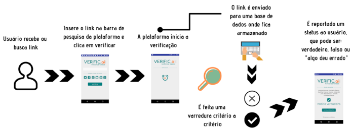
Figura 2 – Sequência de ações de funcionamento do Verific.ai.

O Verific.ai funciona a partir da lógica de um buscador de informações, possuindo uma interface que remete ao Google – projetada com uma barra de pesquisa onde o usuário coloca o link que pretende verificar, seleciona abaixo dele um botão referente à fonte daquela informação (blogs, redes sociais ou sites) e clica em verificar, seguindo modelo da Figura 2. O software da ferramenta aplica o conceito de mineração de dados ( data mining ) para fazer uma varredura na web, a partir dos critérios definidos previamente, e, com base neles, apontar como resultado final se o link tem conteúdo verdadeiro ou falso.