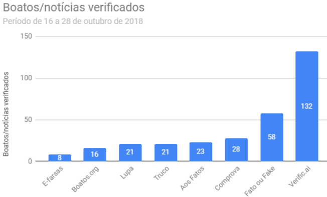
Figura 6 – Gráfico de boatos/notícias verificados por sete veículos e o Verific.ai.