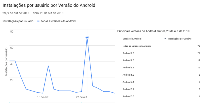
Figura 3 – Instalações por usuário por versão Android entre os dias 9 e 28 de outubro de 2018.

Até o dia 28 de outubro de 2018, quando foi fechada a janela de captação de dados, a plataforma teve 269 instalações por usuário único em 271 dispositivos diferentes. Observa-se, a partir da análise dos gráficos projetados no Google Play Console – ferramenta de armazenamento da plataforma para os desenvolvedores – que o dia em que houve mais instalações por usuário único e em dispositivos foi 23 de outubro de 2018. Somente nesse dia, foram realizadas 70 instalações por usuário único em 69 dispositivos, representando 26% do total de instalações efetuadas durante o período de testes, conforme Figura 3.